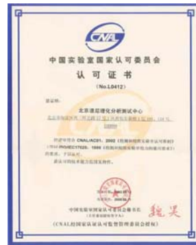
国家实验室认可证书